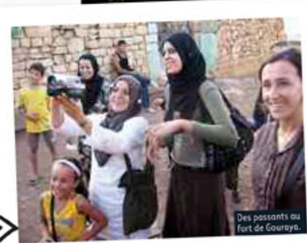
Des passants au fort de Gouraya.