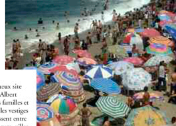
La plage d'Alger.

Les cahiers de chansons circulent et hommes et femmes recommencent les mêmes chansons avec ardeur ! Cette gaieté et cette insouciance vont à l'encontre des préjugés qui sont véhiculés sur ce pays. Ce voyage est humainement l'un des plus riches que nous ayons fait. ➤➤