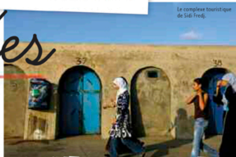
Le complexe touristique de Sidi Fredj.

Notre voilier éveille la curiosité et le dialogue. Immortalisé sur bon nombre de téléphones portables, il nous permet de nouer des amitiés que nous conserverons. Il faut préciser qu'en plein